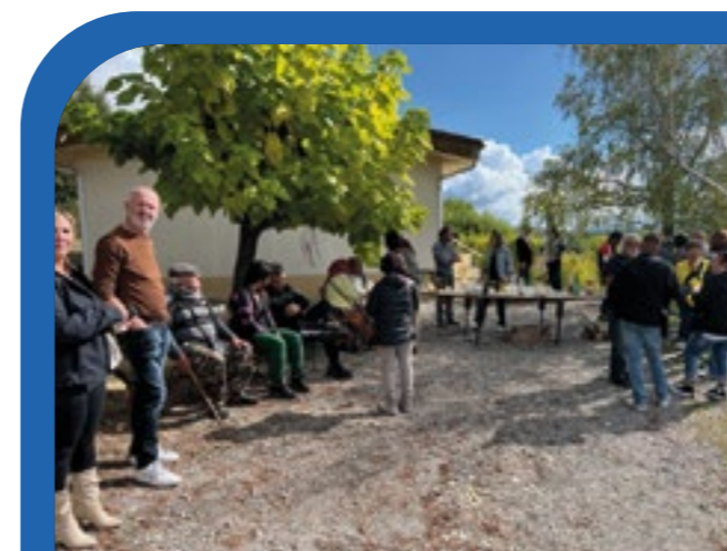
JOURNÉE D'HOMMAGE AUX HARKIS Dimanche 25 septembre 2022

RÉUNION PUBLIQUE le vendredi 27 janvier 2023 à 18 H à la salle polyvalente de la cure.